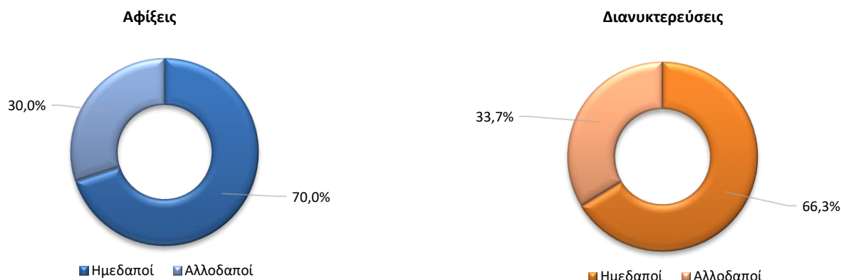
Γράφημα 3. Κατανομή αφίξεων και διανυκτερεύσεων ημεδαπών και αλλοδαπών ανά είδος καταλύματος, Δεκέμβριος 2023 (προσωρινά στοιχεία)