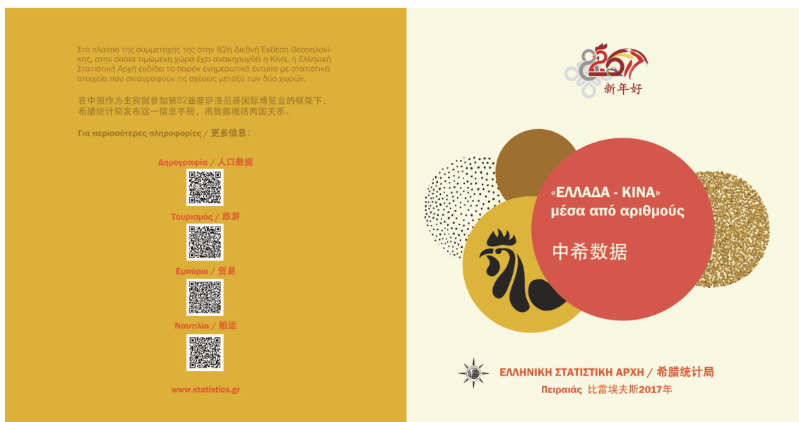
Εικόνα: Το εξώφυλλο της έκδοσης «ΕΛΛΑΔΑ – ΚΙΝΑ μέσα από αριθμούς».

http://www.statistics.gr/documents/20181/5346500/elstat_greece_china.pdf/3d4d8f69-a87d-4b9f-a082-bf4fb9ca4c22