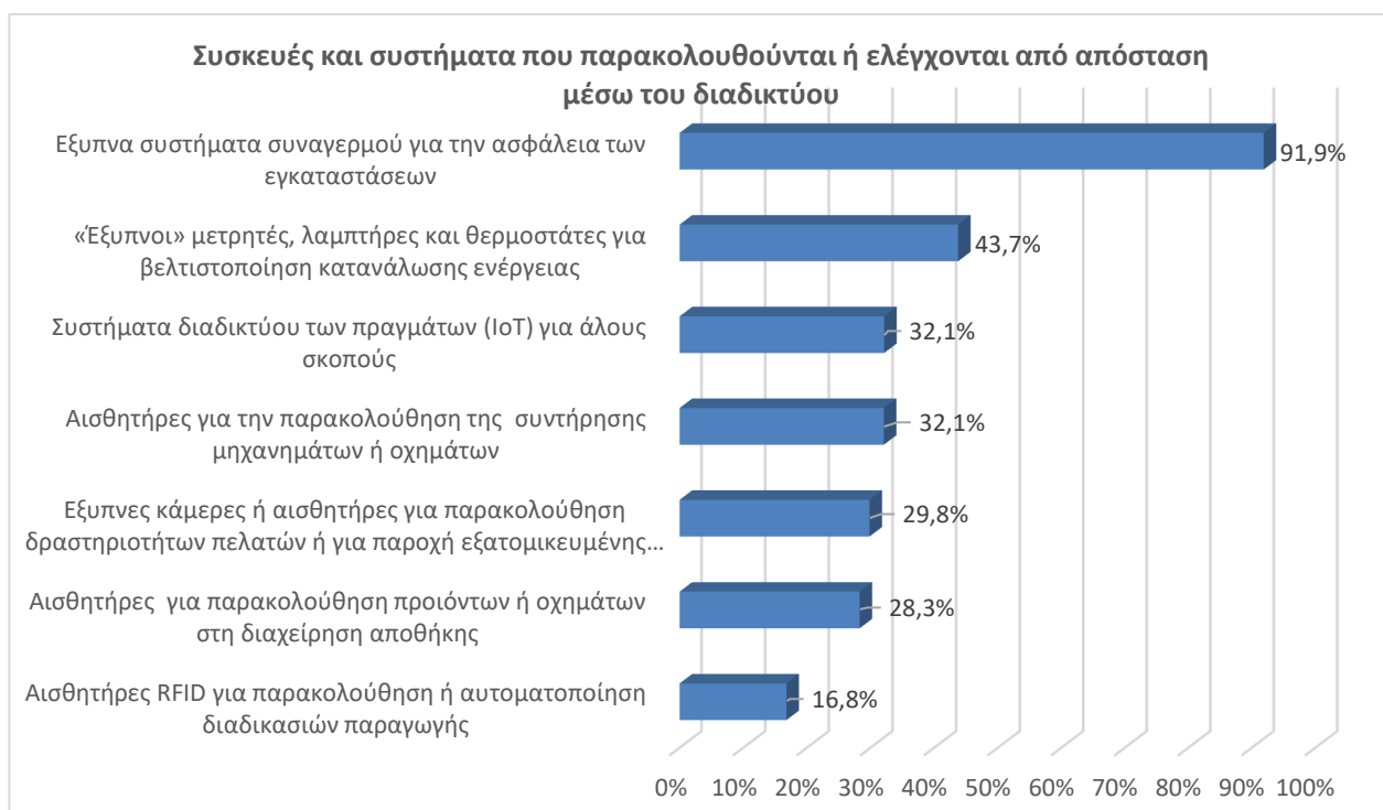
Γράφημα 3 : Διαδίκτυο των πραγμάτων (Internet of Things), 2021

Σημείωση: Το ερώτημα που τέθηκε στις επιχειρήσεις, είναι πολλαπλών επιλογών.