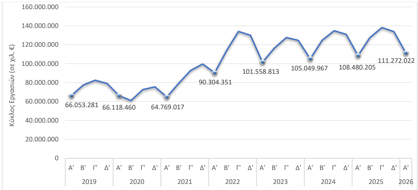
Γράφημα 1. Εξέλιξη Τριμηνιαίου Κύκλου Εργασιών (σε χιλ. €) για το Σύνολο των Επιχειρήσεων της Οικονομίας

Τη μεγαλύτερη αύξηση στον κύκλο εργασιών το πρώτο τρίμηνο 2026 σε σύγκριση με το πρώτο τρίμηνο 2025 παρουσίασαν οι επιχειρήσεις του τομέα Κατασκευές κατά 17,4%, ενώ τη μεγαλύτερη μείωση παρουσίασαν οι επιχειρήσεις του τομέα Δραστηριότητες Υπηρεσιών Παροχής Καταλύματος και Υπηρεσιών Εστίασης, κατά 1,0% (Πίνακας 1).