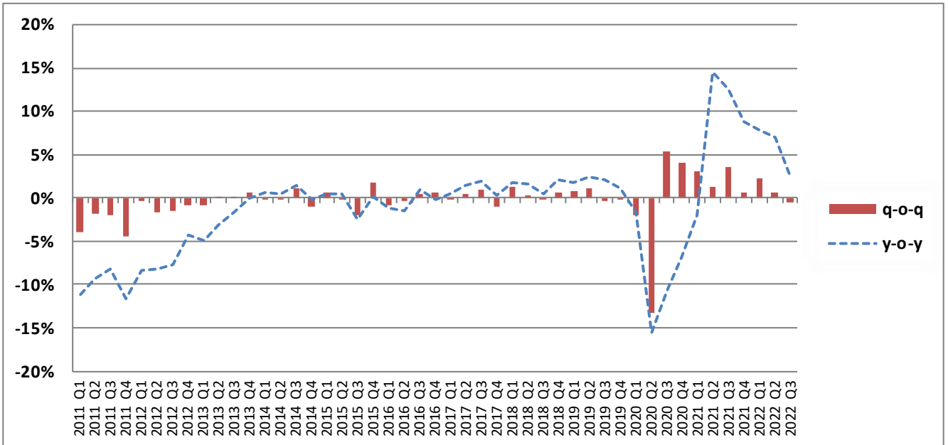
Διάγραμμα 2: Ακαθάριστο Εγχώριο Προϊόν (ΑΕΠ) σε όρους όγκου (Έτος Αναφοράς: 2015) ΜΕ και ΧΩΡΙΣ Εποχική Διόρθωση 2011-2022