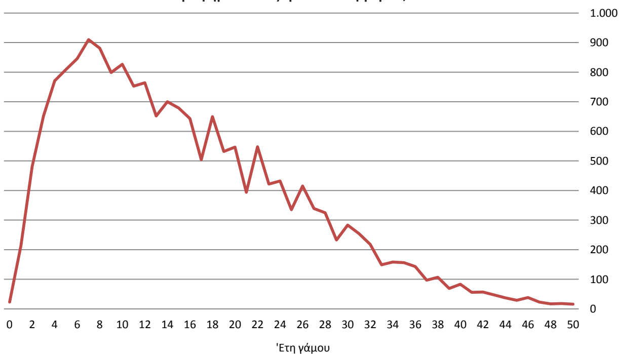
Γράφημα 3. Διαζύγια ανά έτη γάμου, 2017